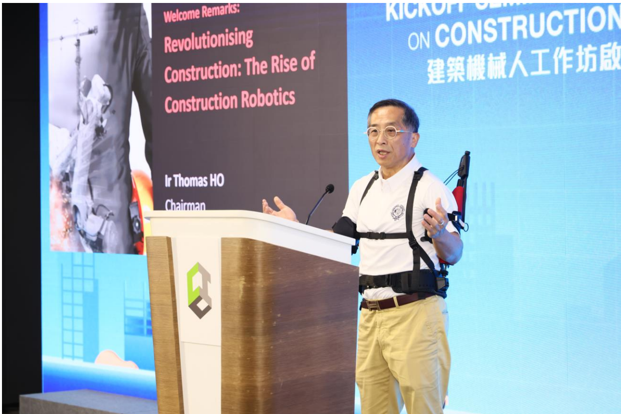
建造業議會主席何安誠工程師於建築機械人工作坊啟動研討會致歡迎辭