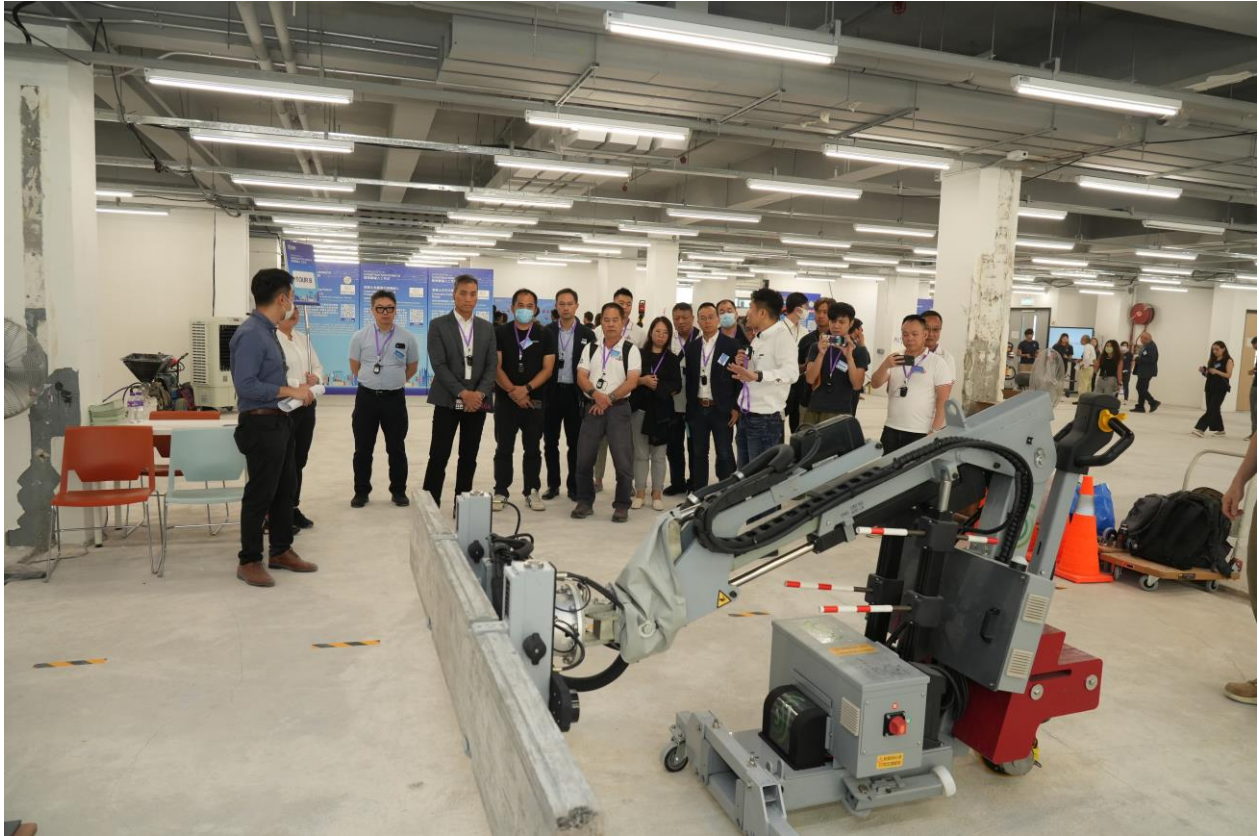
業界對建築機械人工作坊反應熱烈