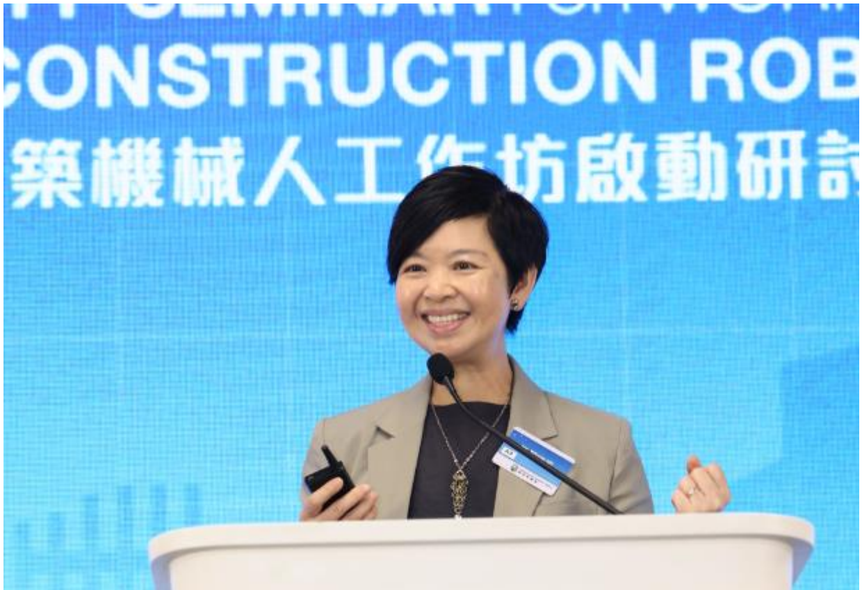
房屋局局長何永賢女士於建築機械人工作坊啟動研討會致開幕辭