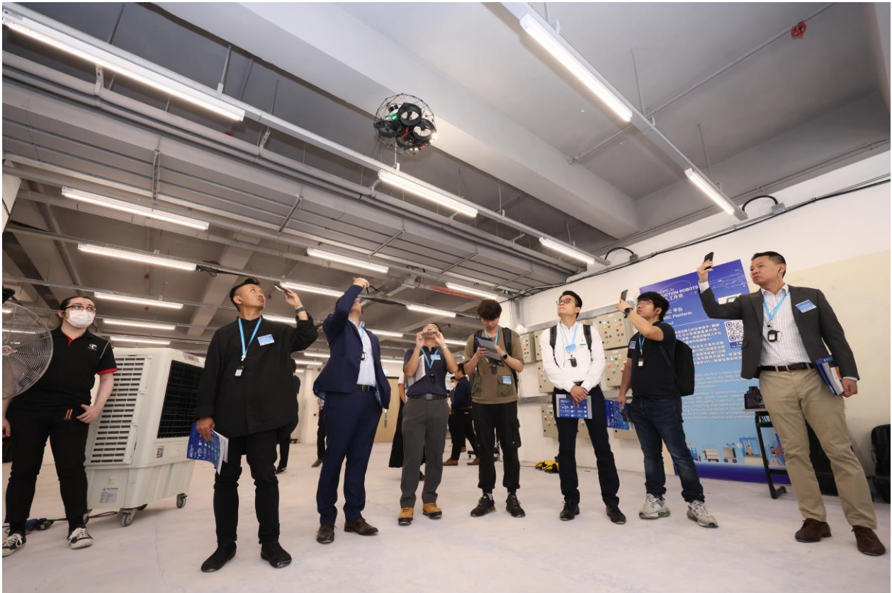
業界對建築機械人工作坊反應熱烈