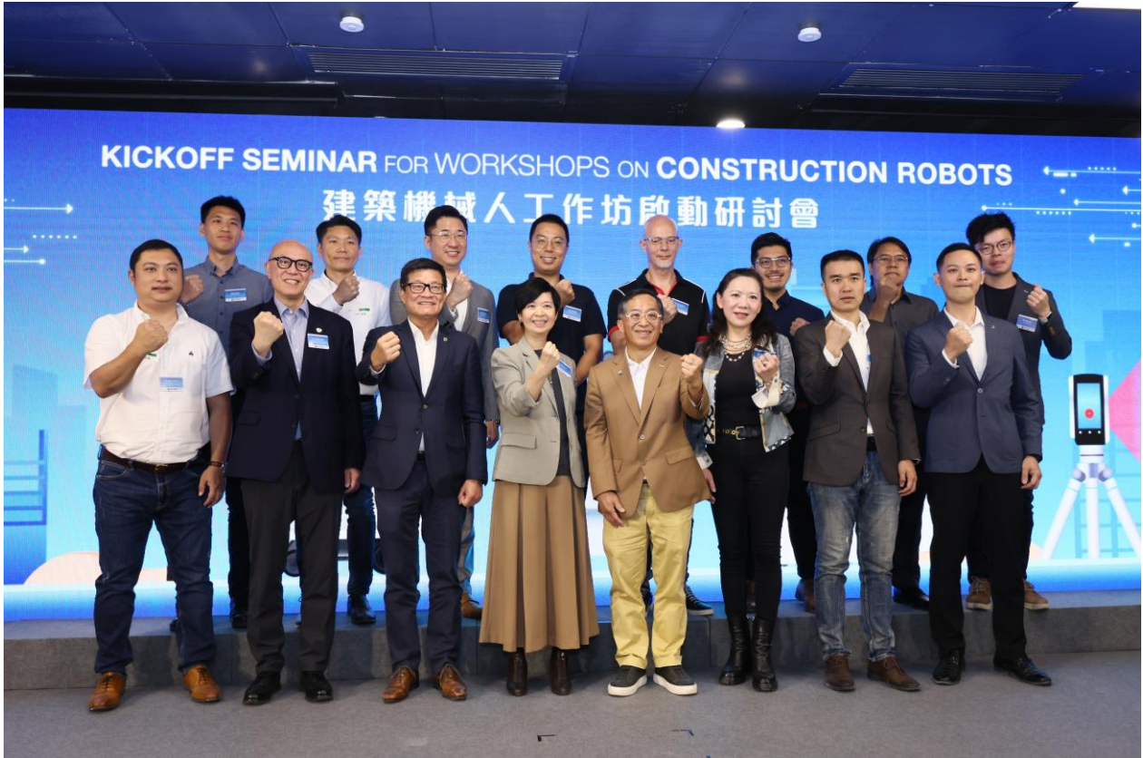
建築機械人工作坊得到本地及世界各地機械人公司支持