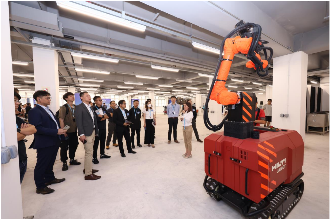
業界對建築機械人工作坊反應熱烈