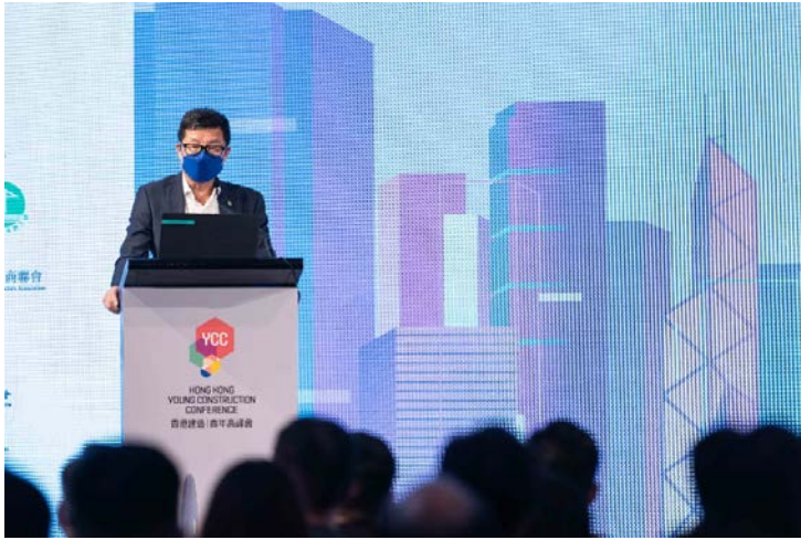
建造業議會執行總監鄭定寧工程師於「香港建造青年高峰會」上發表講話