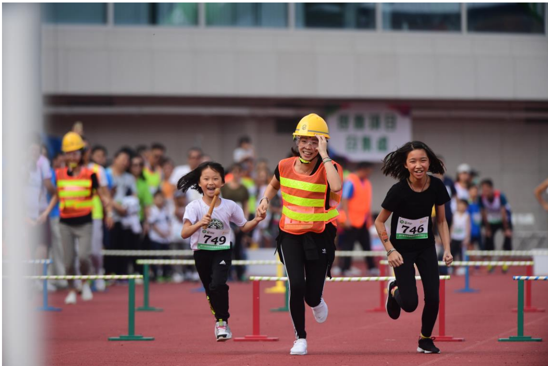
「親子障礙賽」吸引了 25 隊家庭參與，場面溫馨