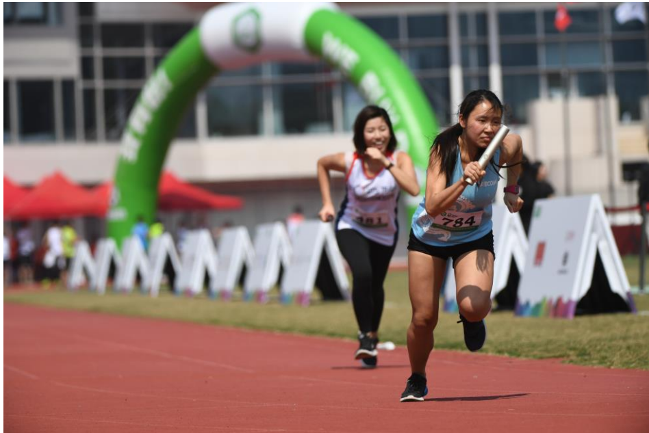
女子混合 4 x 100 公尺接力賽戰況激烈