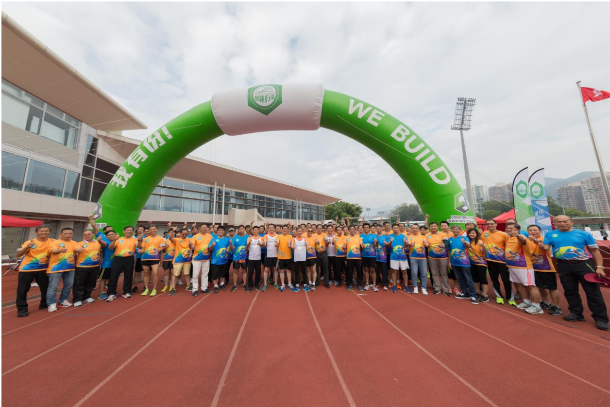
「400 米建造業關懷慈善跑」參賽健兒於起跑前合照