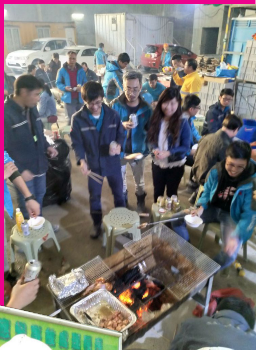
▶ 新輝建築為員工舉辦燒烤活動

上個月有段時間好凍，公司都好體貼，送暖包俾我哋每個工友。個人暖啲，做嘢係會醒神啲嘅！多謝老細！！”