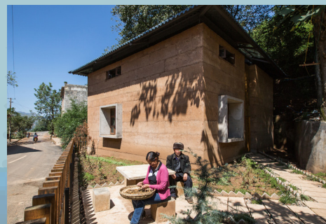
▲ 光明村災後重建示範項目