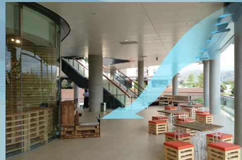
▼ 運用空氣動力學原理的科研技術