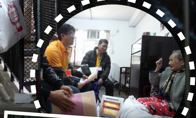
建造業議會義工隊