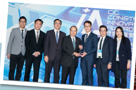
▲ 署理行政長官張建宗先生（中）頒發青年創新獎予奧雅納得獎隊伍。

相比於掛牆式風扇，AIU風力範圍更廣，運作亦更寧靜及高效。無扇葉的簡約設計在使用上更安全，且易於清潔和維修，更能配合不同環境的設計。此技術已申請了英國和香港的專利，並獲得多個機構的認可。