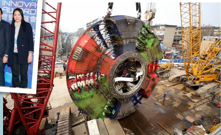
▲ 支持地鐵及地下工程吊裝盲區安全的便攜式敏捷物聯網監控系統