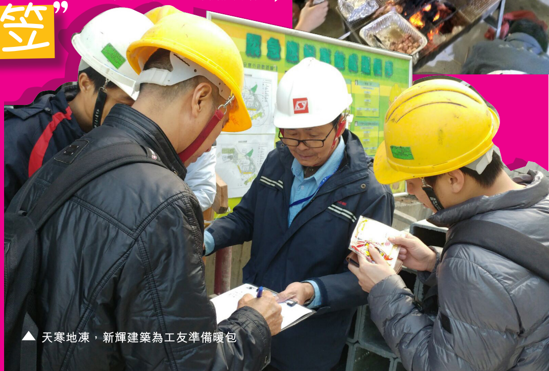
▲ 天寒地凍，新輝建築為工友準備暖包