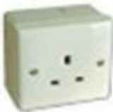
500W 電源插座 – $800