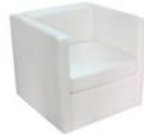
白色單人沙發 – $800