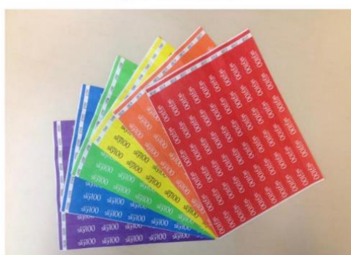
天際100 手帶 sky100 Wristband

Images are for reference only. Quantities are subjected to availability.