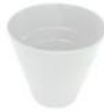
廢紙箱 – $100