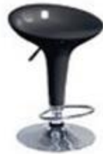
黑色太空吧椅 – $400