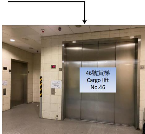
46號貨梯 Cargo lift No.46