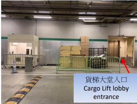
貨梯大堂入口 Cargo Lift lobby entrance