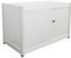
儲物櫃 (1000 x 500 x 1000 高毫米) – $800