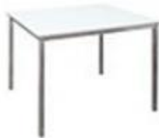
白色正方形桌 (75 x 75 x 75 厘米高) – $400