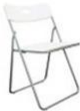
白色摺椅 – $120