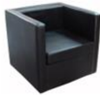
黑色單人沙發 – $700