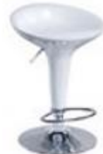
白色太空吧椅 – $400