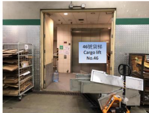
46號貨梯 Cargo lift No.46