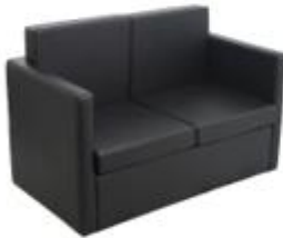
黑色雙人沙發 – $1400