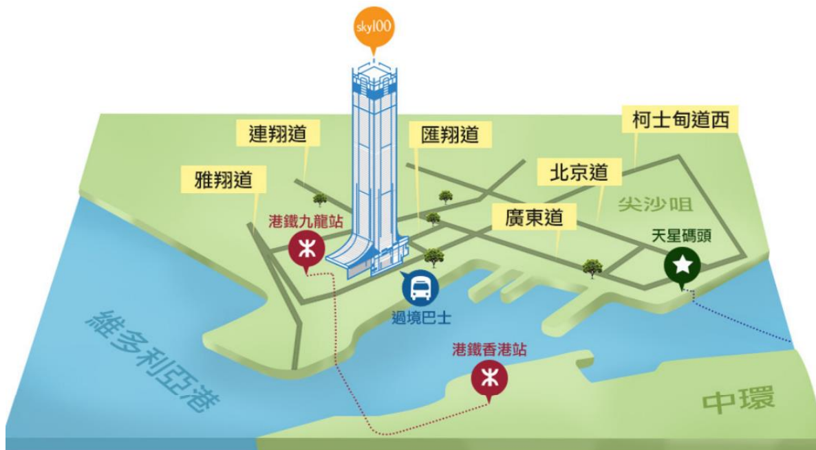
天際100香港觀景台入口