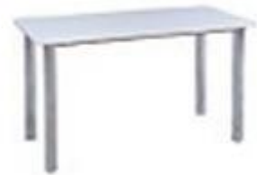
白色長桌 (120 x 70 x 75 厘米高) – $800