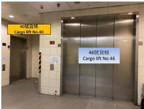
40號貨梯 Cargo lift No.40

L46 號貨梯 The information of the L46 cargo Lift