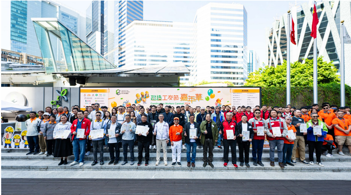
建造業議會嘉許建造工友的专业及贡献