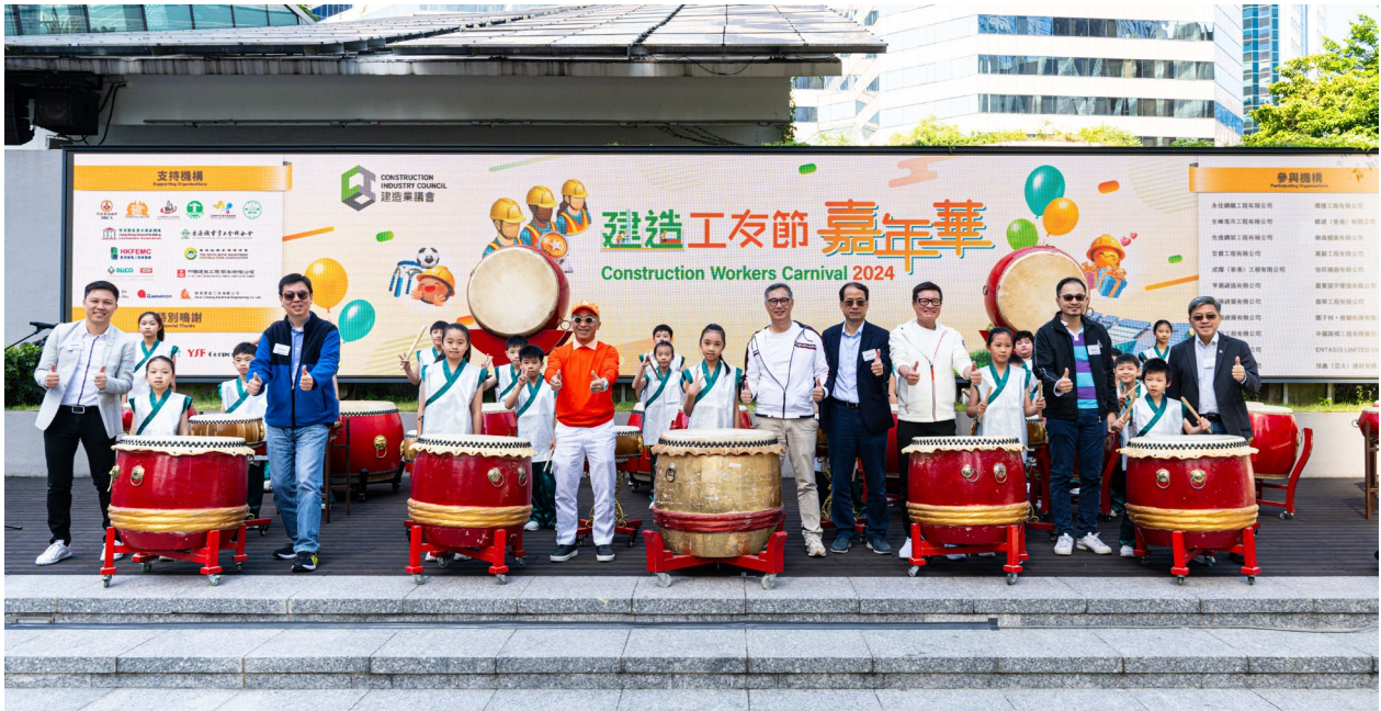
發展局常任秘書長（工務）劉俊傑工程師（前排左七）、建造業議會主席何安誠教授工程師（前排左五）、建造業議會執行總監鄭定寧工程師（前排右五）及勞工處副處長（職業安全及健康）馮浩賢先生（前排左三）與一眾嘉賓為「建造工友節嘉年華」揭開序幕