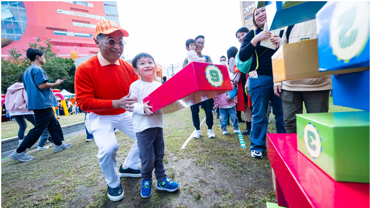
現場設置多個攤位遊戲，向業界及工友傳遞建造安全訊息