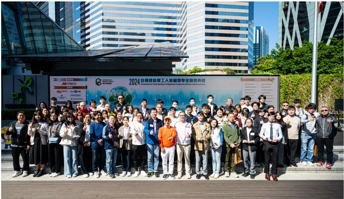
嘉年华同场举行第14届「注册建造业工人家属奖学金」颁奖典礼