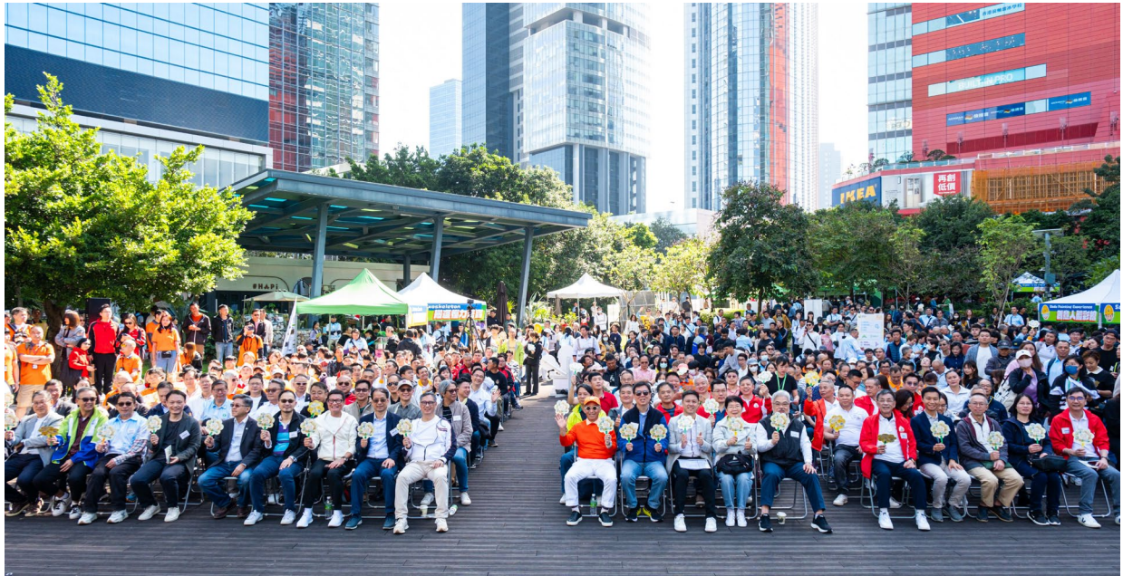
建造工友節嘉年華吸引逾 6,000 人參與