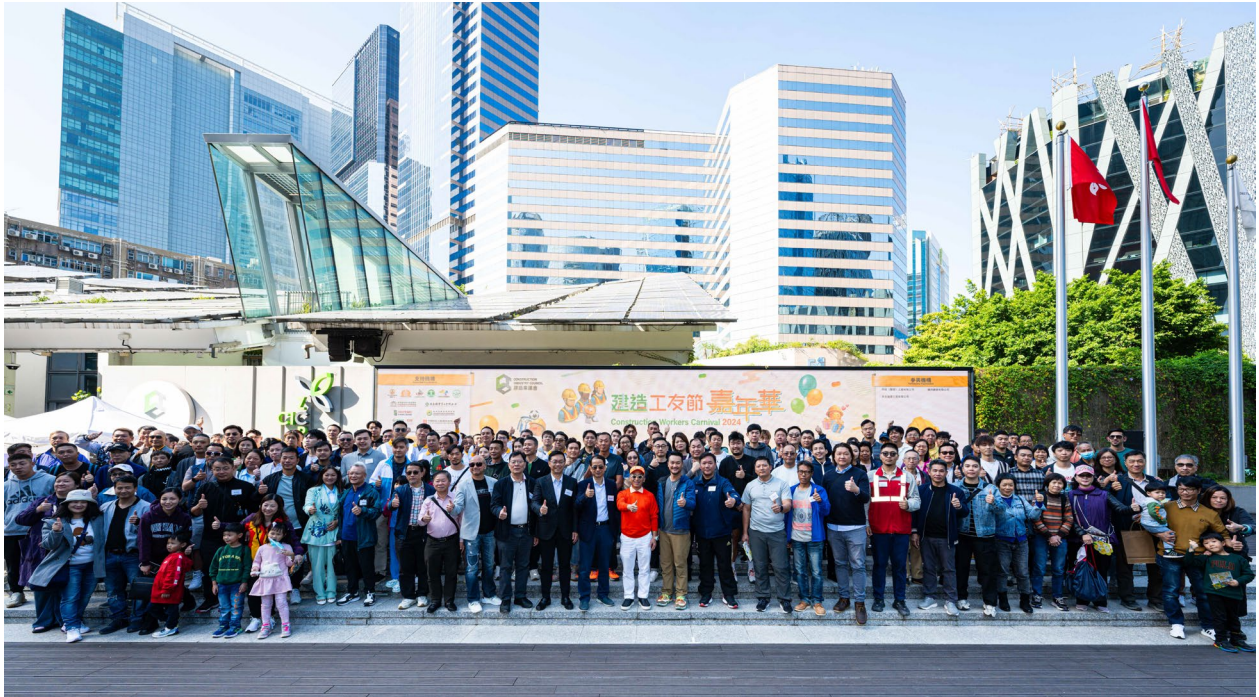
各嘉賓、工友及其家人參與建造工友節嘉年華，共享喜悅時刻