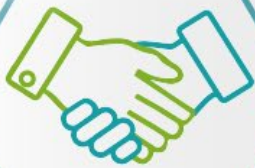
誠信管理 Integrity Management

註冊續期申請必須提交高級管理人員誠信培訓記錄 Submit integrity training records of senior management staff for renewal application