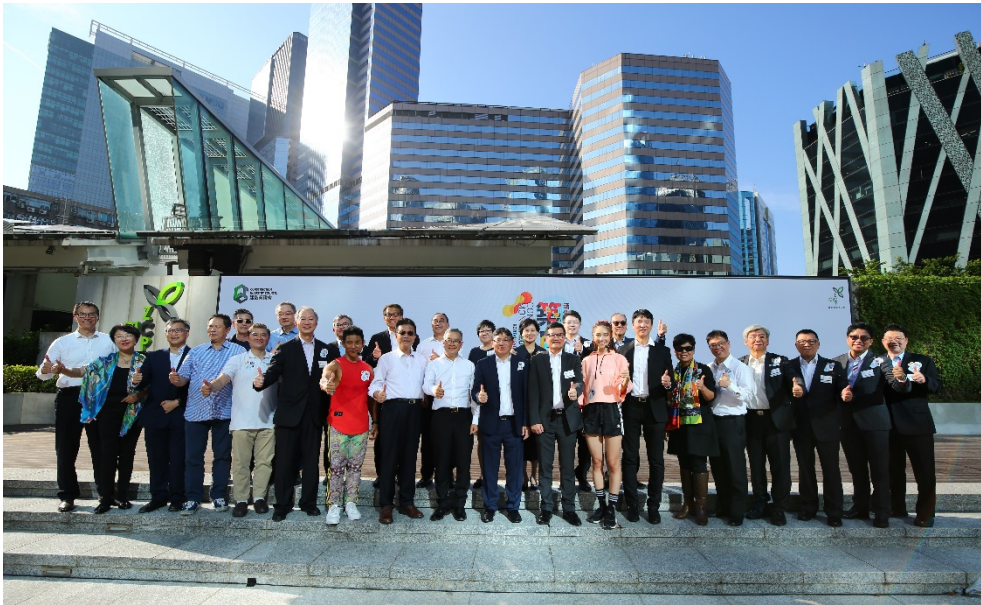
多名建造業議會成員及嘉賓出席「築月 2019」開幕禮。