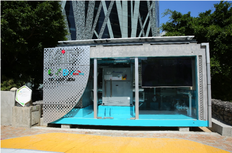
零碳天地致力提升園區綠色設施，包括全港首個機電組裝合成雨水製冷系統。