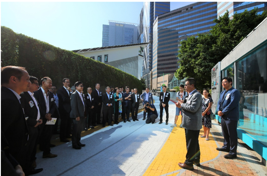
導賞團參觀建造業零碳天地的全新綠色設施。