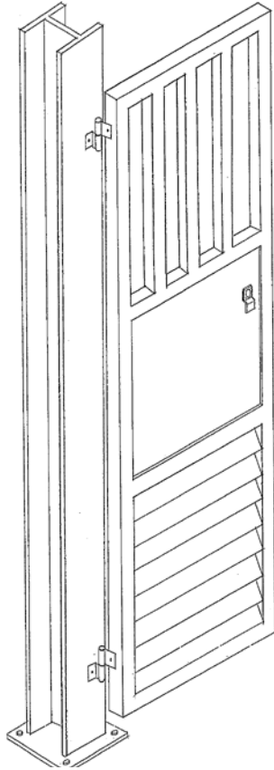
ٹریڈ ٹیسٹ مقام (دھاتی پینٹ اسپرے) ظاہری نقشہ