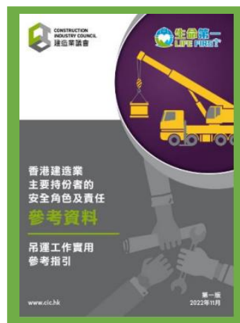
參考資料 - 香港建造業主要 持份者的安全角色及責任 (吊運工作實用參考指引)