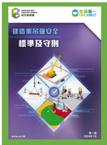
建造業吊運安全 標準及守則