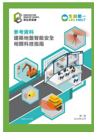
參考資料 - 建築地盤智能安全相關科技指南