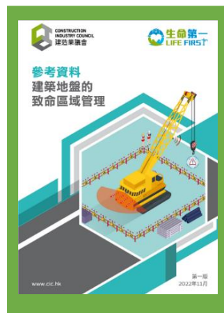
參考資料 - 建築地盤的致命區域管理