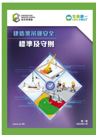
建造業吊運安全標準及守則