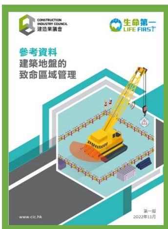
參考資料 - 建築地盤的致命區域管理