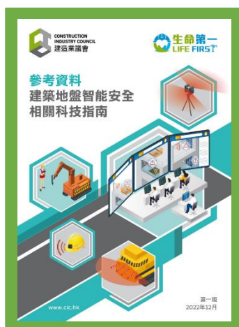
參考資料 - 建築地盤智能安全相關科技指南