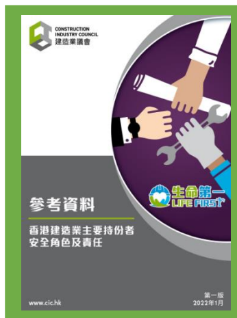
參考資料 – 香港建造業主要持份者安全 角色及責任