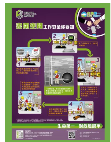
海報 – 密閉空間工作安全你要知