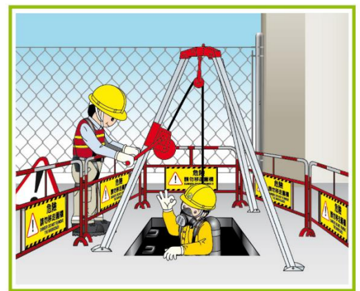
工人須佩戴適當的安全吊帶，該安全吊帶與一條救生繩連接，而其堅固程度須足使他人拉出工友