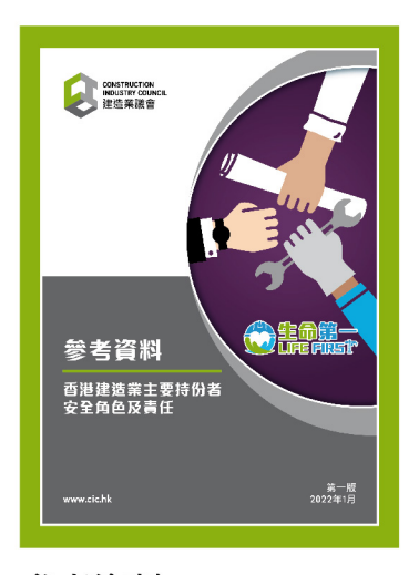
參考資料 — 香港建造業主要持份者 安全角色及責任