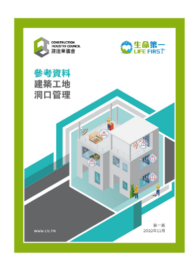
參考資料 — 建築工地洞口管理