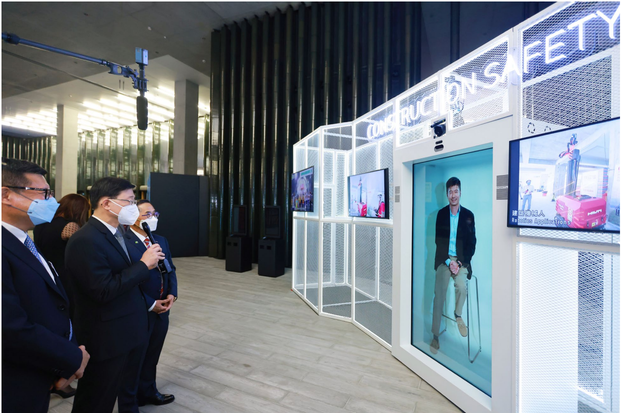
互動全息投影展區