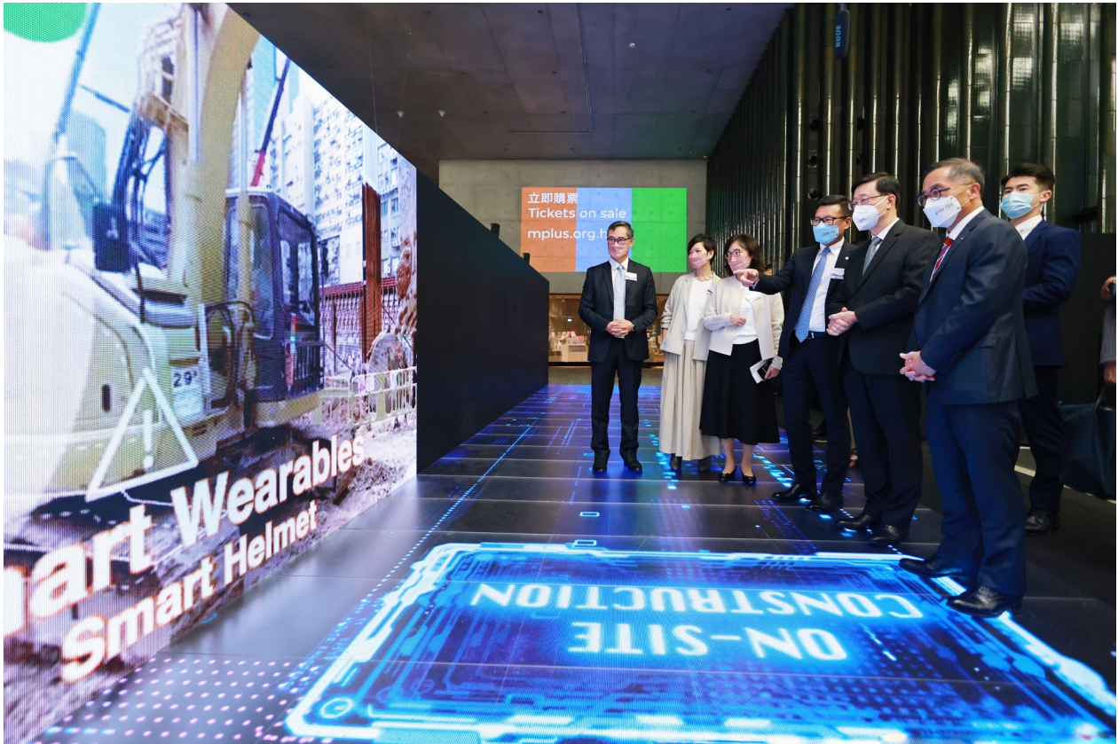
「建築∞未來」LED 數碼走廊