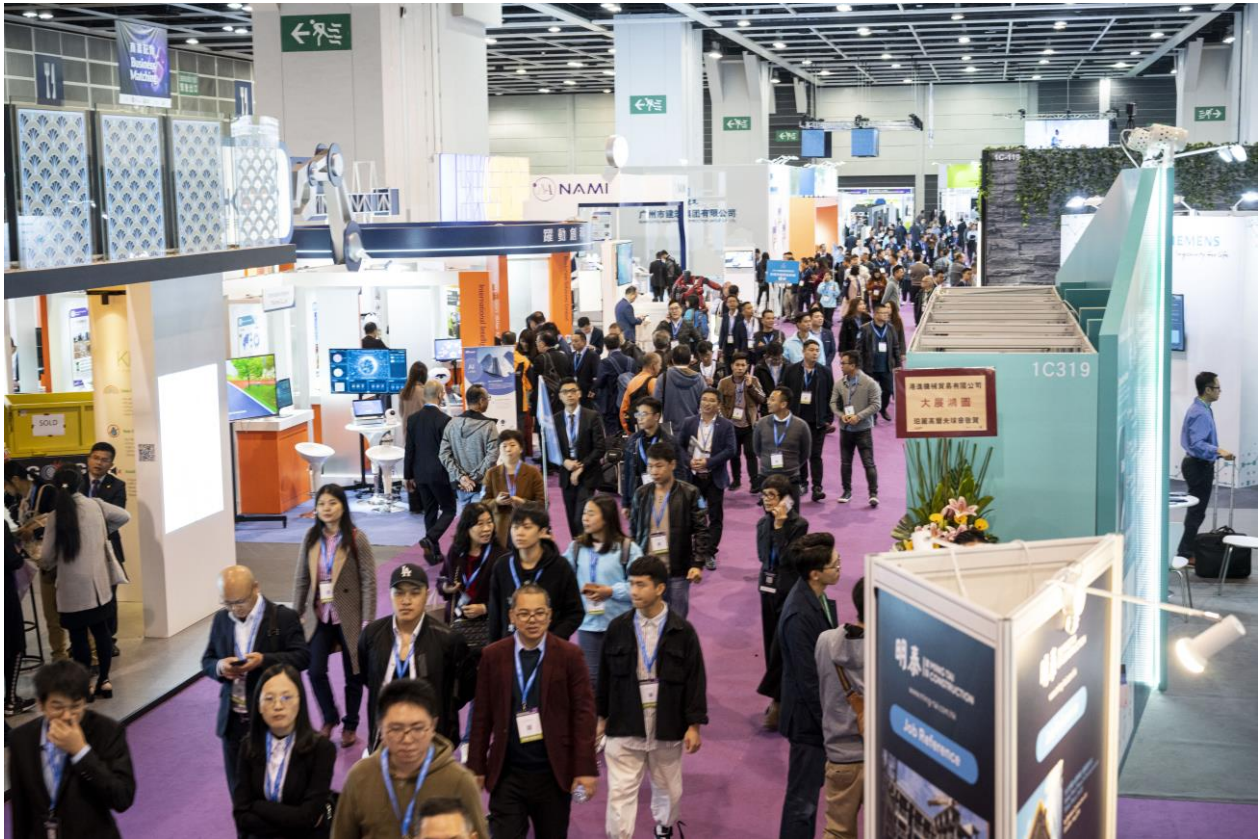
「2019 建造創新博覽會」吸引 228 個本地及海外參展商，超過二萬人次入場參觀