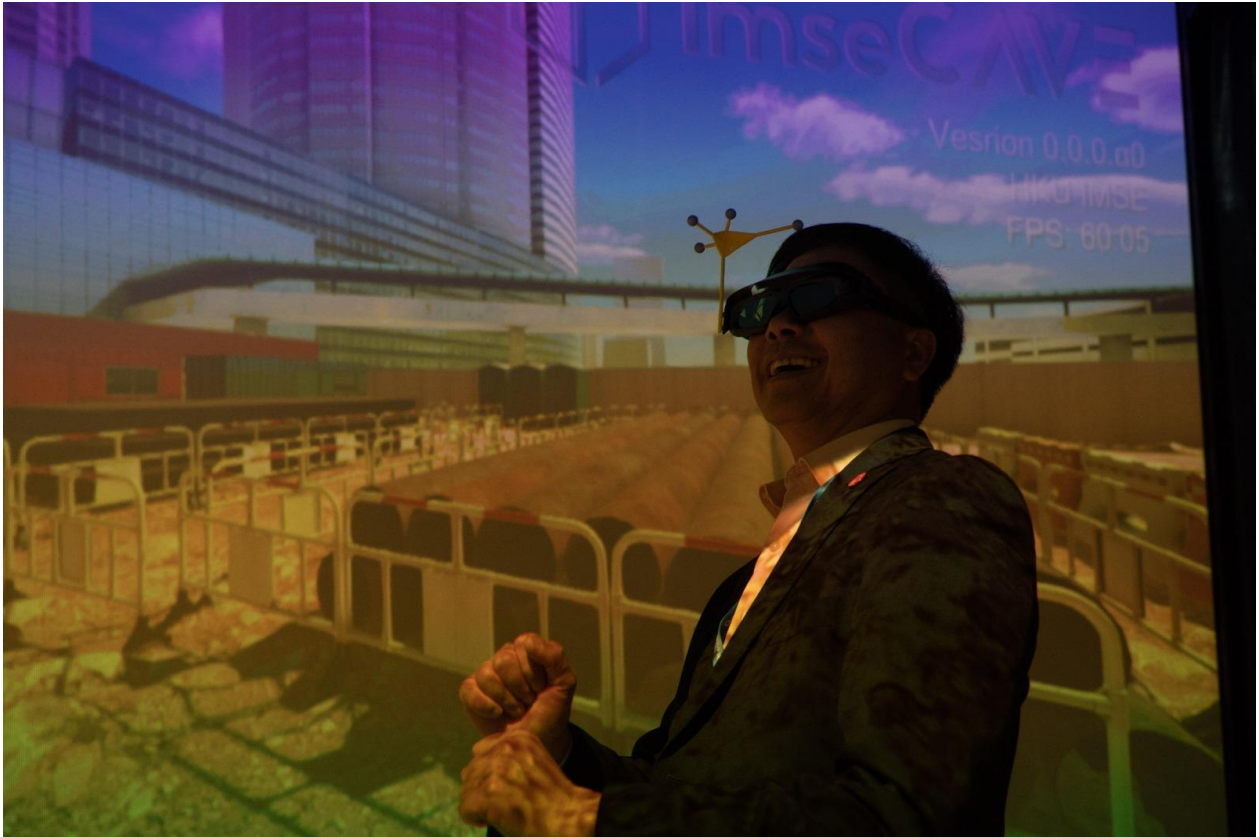
VR Cave 模擬不同工地的環境，以供作安全訓練用途