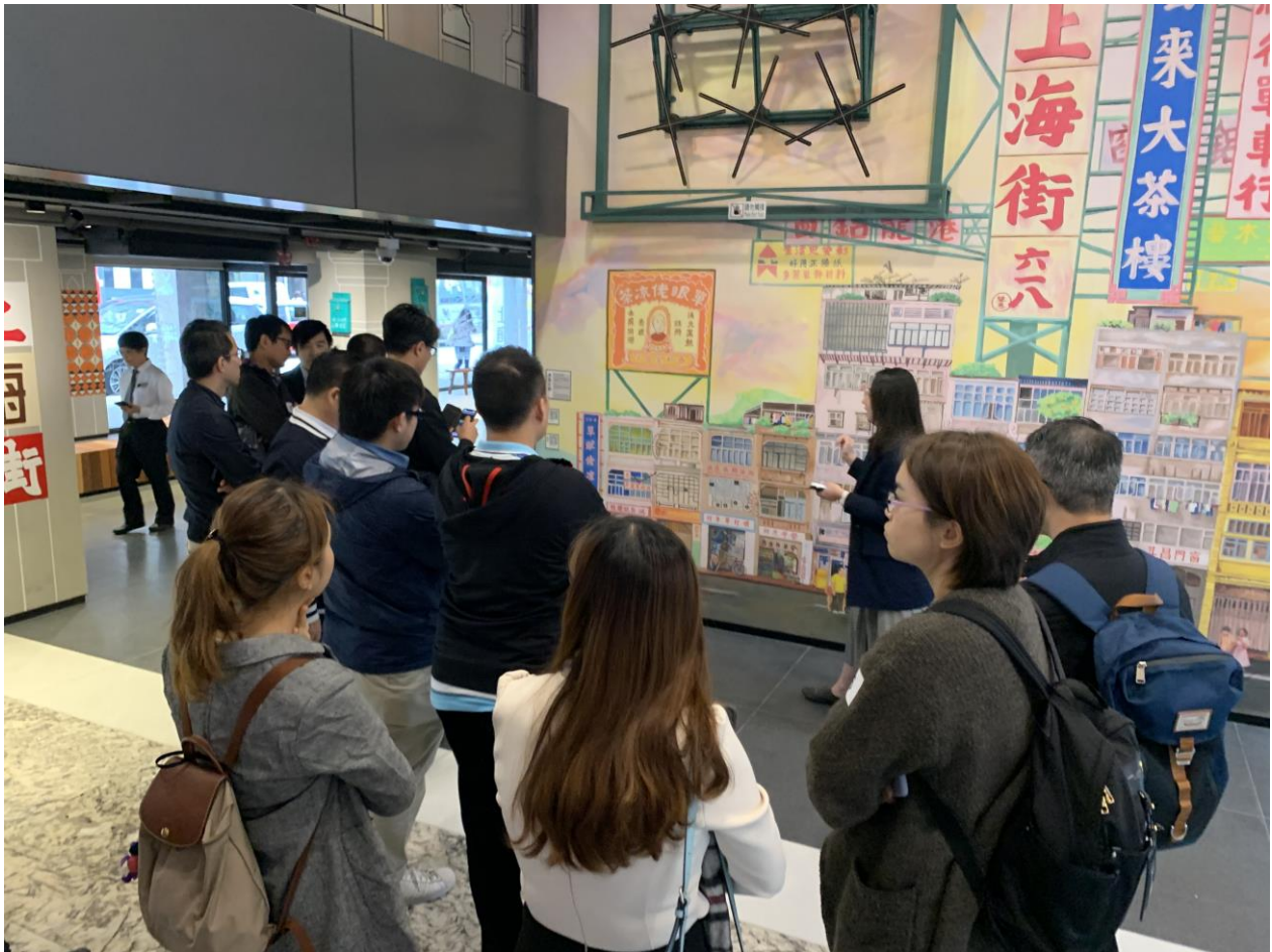
議會亦特別舉辦 10 個建造業技術參觀團，介紹本地新項目的發展