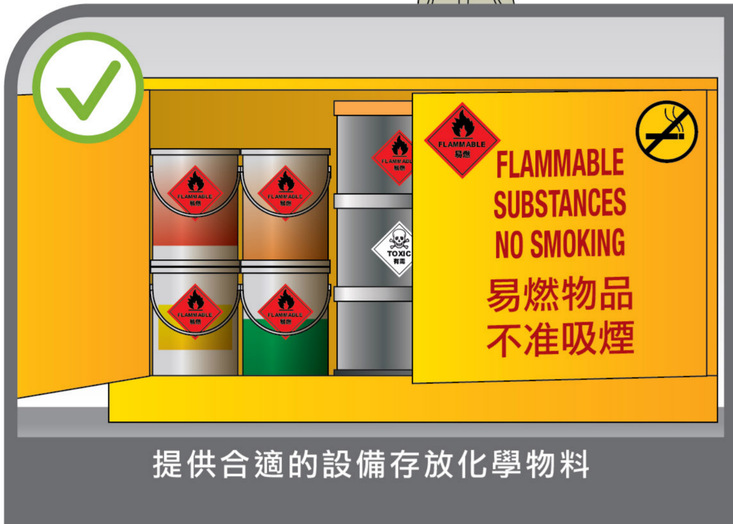
提供合適的設備存放化學物料