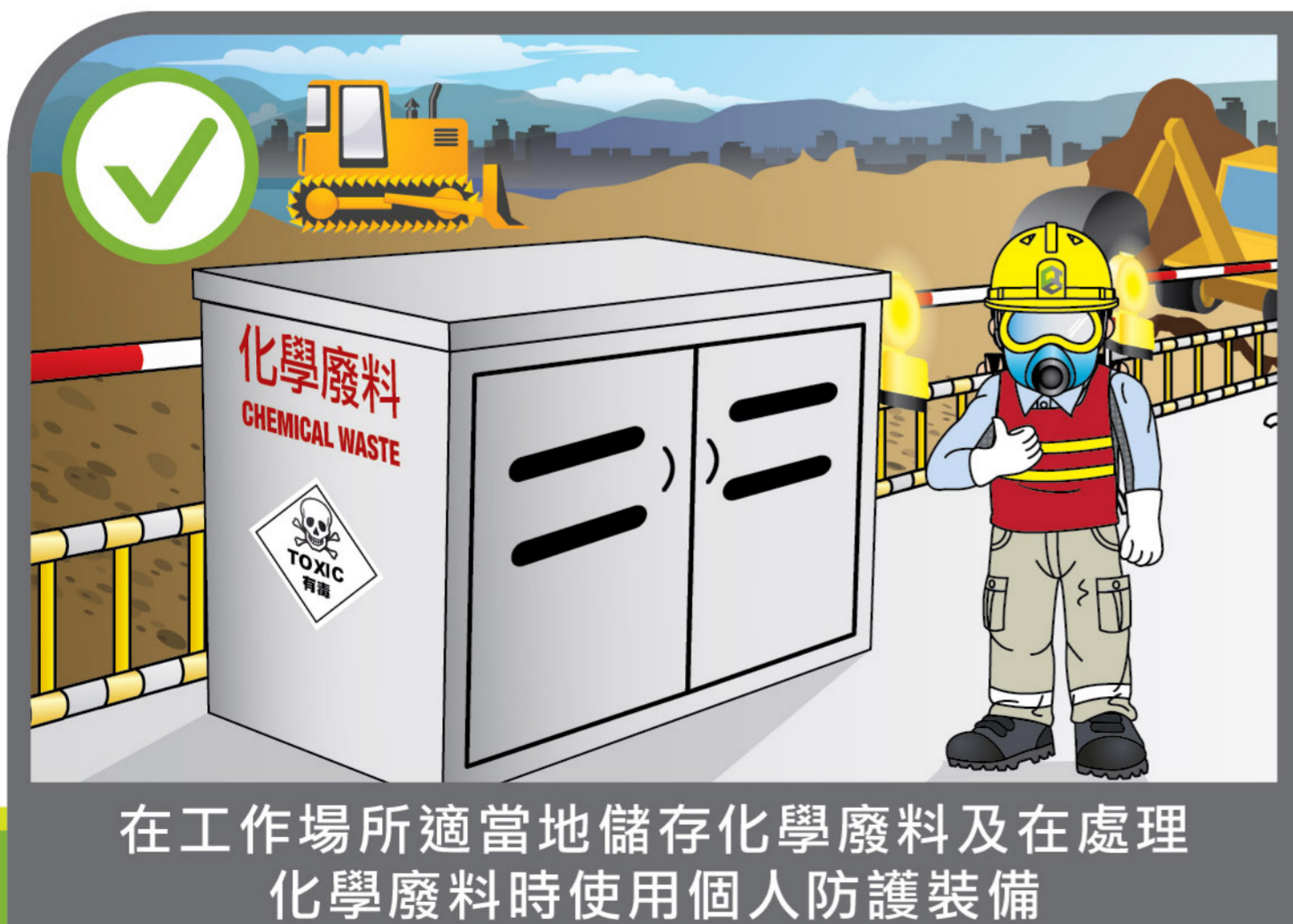
在工作場所適當地儲存化學廢料及在處理 化學廢料時使用個人防護裝備