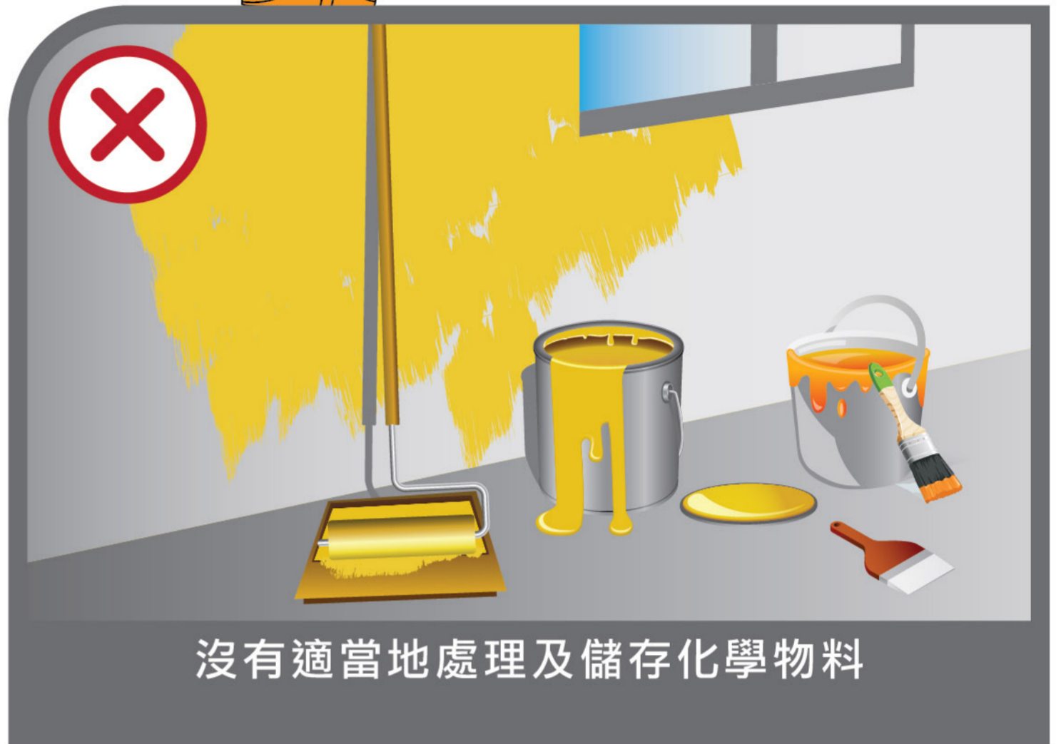
沒有適當地處理及儲存化學物料