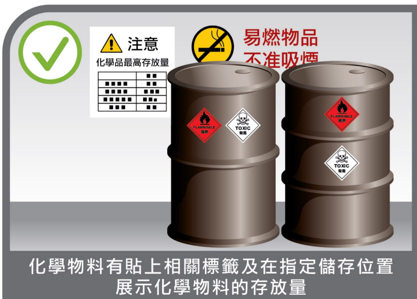
化學物料有貼上相關標籤及在指定儲存位置 展示化學物料的存放量