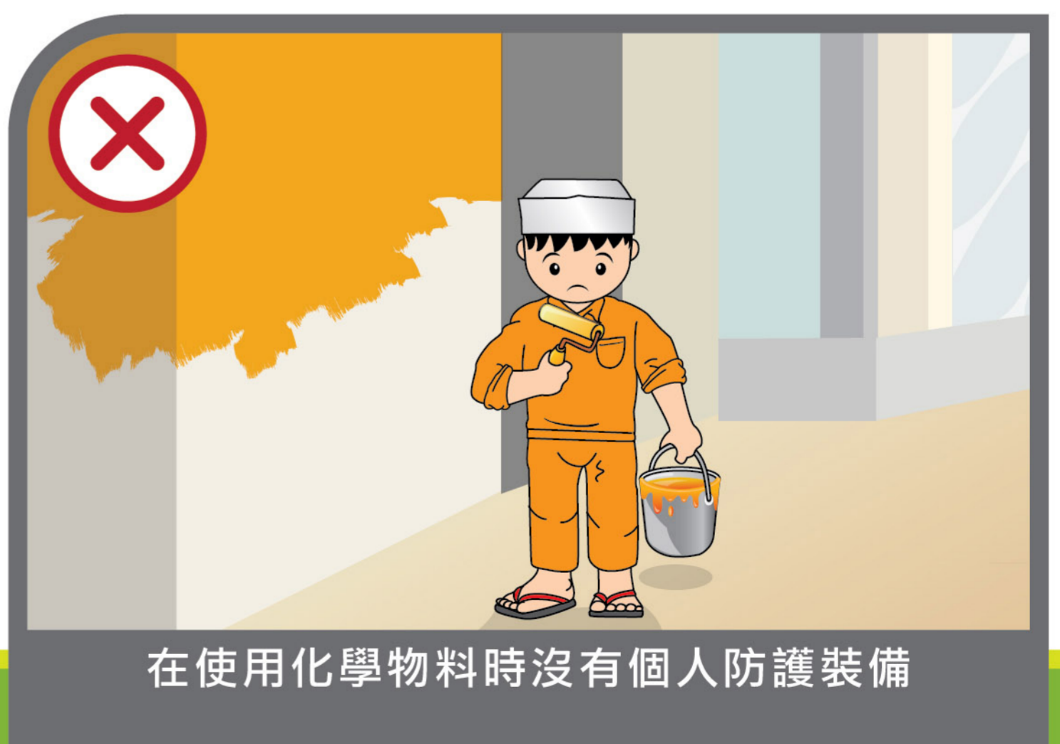
在使用化學物料時沒有個人防護裝備