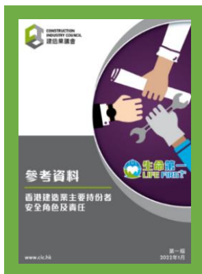
參考資料 – 香港建造業主要持份者 安全角色及責任