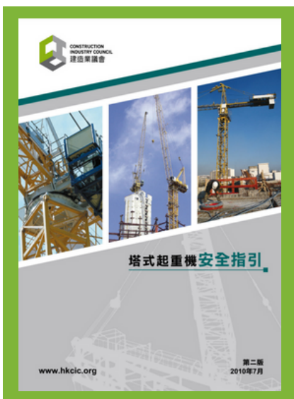
塔式起重機安全指引