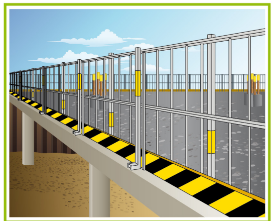
在樓邊設置適當的護欄及底護板。

以上只列出安全重點，詳細內容請參閱《建築地盤（安全）規例》、勞工處發出的《安全帶及其繫穩系統的分類與使用指引》及由建造業議會發出的《高空工作安全手冊》。