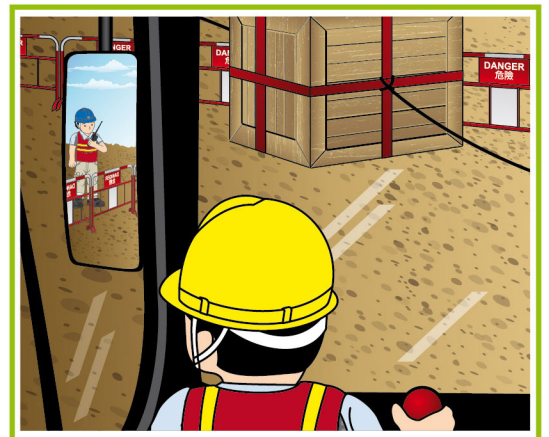
駕駛員有清晰視野。