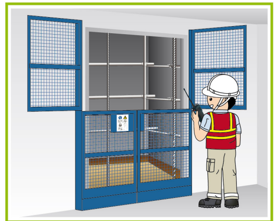
提供足夠及有效通訊設備。