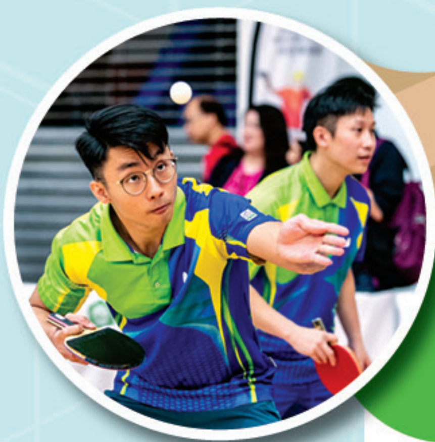
▲ 2019年報名踴躍，超過300名來自40多個不同機構的乒乓球好手參與。