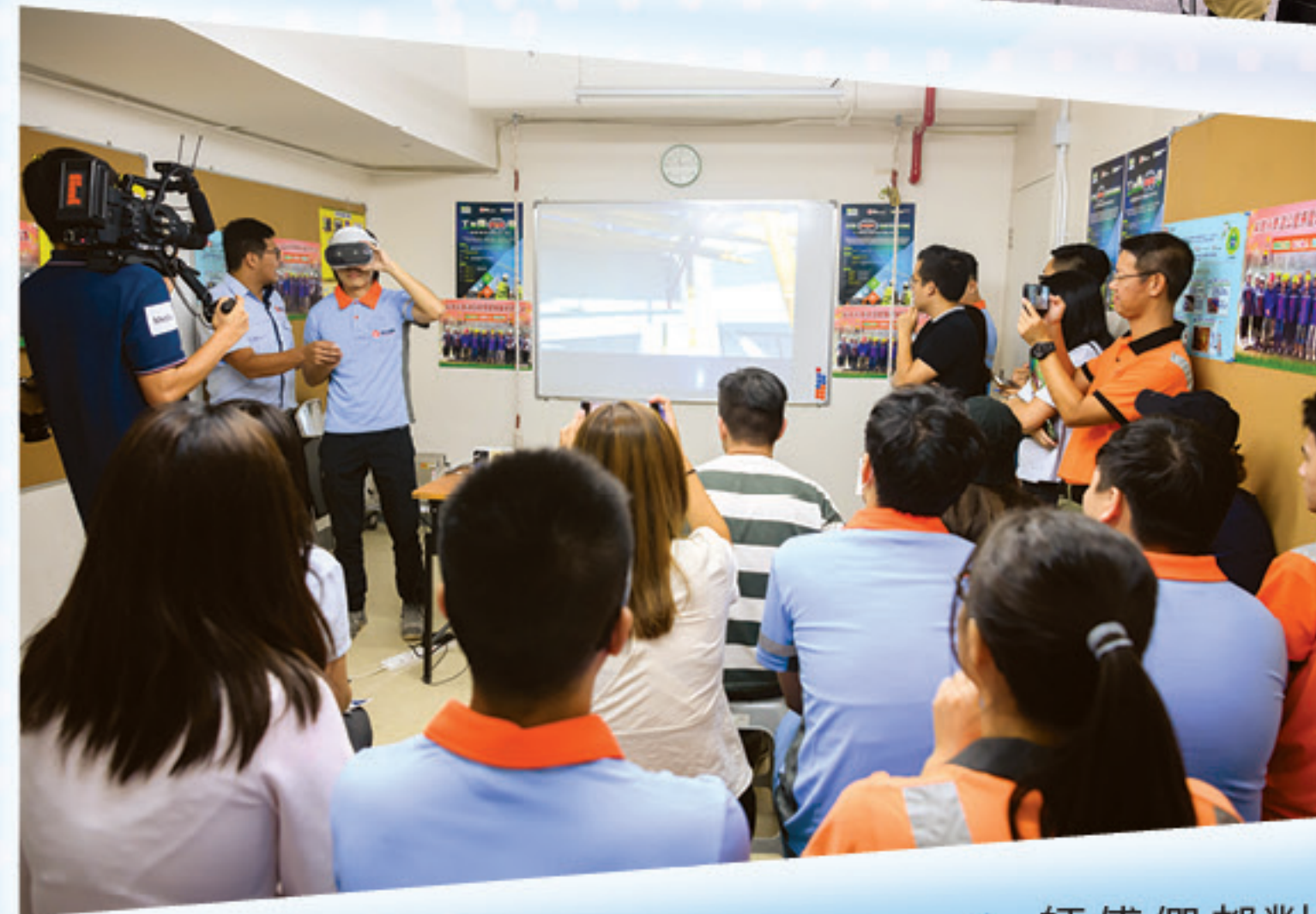
▲ 師傅們都對呢個學安全嘅新模式好感興趣！