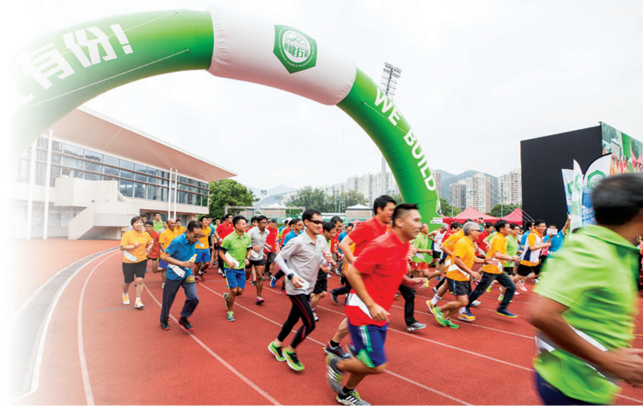
▲ 大家一齊數「三、二、一，啟動」後，CISVP嘅豐富活動多到一發不可收拾！