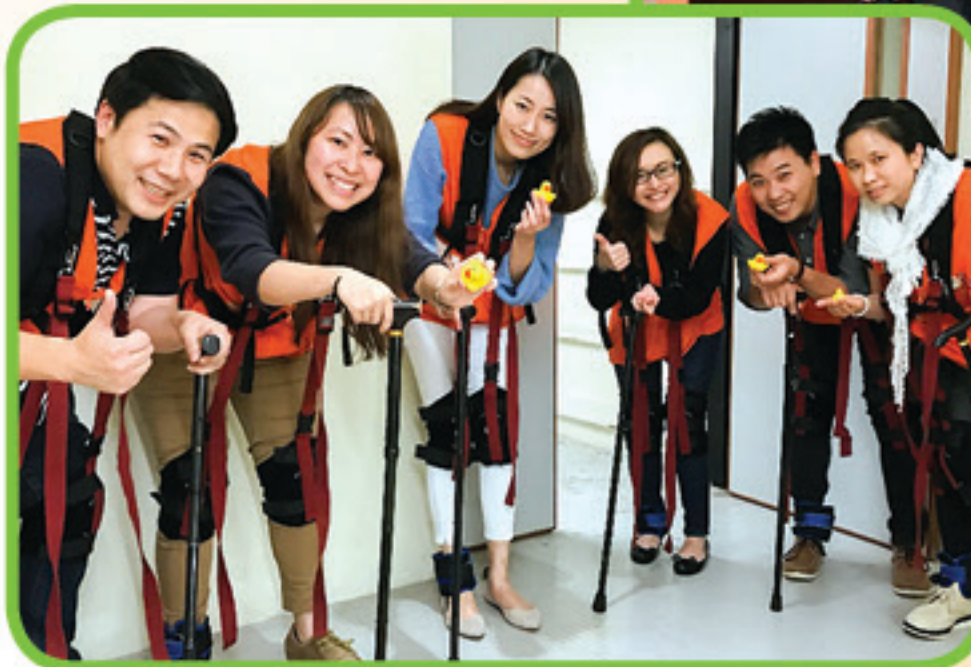
▲ 義工同長者打成一片~ (渠務署網頁圖片) ◀ 「做老人家」一啲都唔容易！(渠務署網頁圖片)