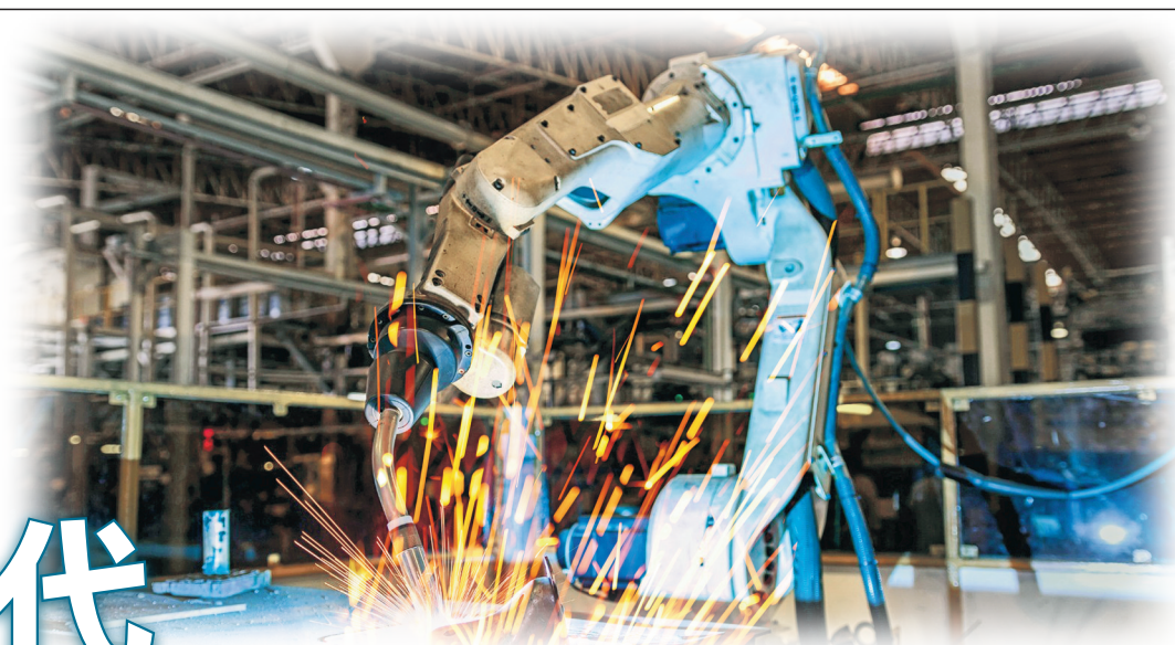
▲創新科技將會在建造業上大派用場，例如機械人可代替危險工作，並節省人力。

首屆「建造創新博覽會」（創博會）將於12月17日至20日舉行，除了展示領先建築技術外，逾40位業界權威將在多場國際會議上分享最新建築議題。期間亦會頒發「2019建造業議會創新獎」，讓參與者了解創新科技的力量，如何提升建造業的工作效益。