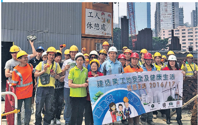
總工會於去年舉行了131場工地講座，周聯僑直言工友反應很好，十分值得。