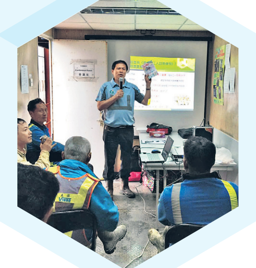
周聯僑致力提升業界的職安健意識，例如推行「工地巡迴講座」。