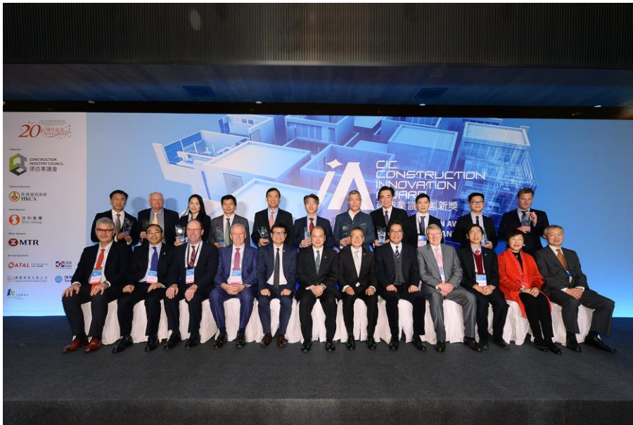
香港特別行政區署理行政長官張建宗先生（前左六）、發展局局長黃偉綸先生（前右五）及建造業議會主席陳家駒先生（前右六）與得獎隊伍代表及評審團合照