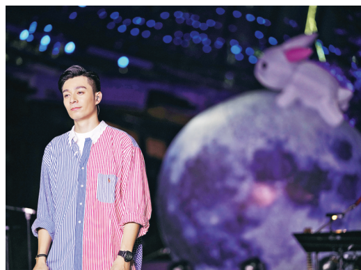
▲周柏豪藉音樂會感謝建造業工友在疫情期間堅守崗位，亦希望大家支持關愛行動，幫助受疫情影響的建造業工友和家人。

零碳天地特別製作四米高的月球燈佈置現場，讓大眾在觀看時也感受節日氣氛。周柏豪表示：「受疫情影響，某些行業還可以在家工作，但建造業工友為了繼續令社會正常運作，無論風吹雨打仍堅守崗位。我很高興可以一盡綿力，藉音樂會向建造業講聲感謝和致敬，亦希望大家支持『關愛行動』，幫助受疫情影響的建造業工友和家人。」