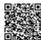
抗疫關愛行動—— 梁詠琪 「打打氣」音樂會

如果早前錯過了兩場網上音樂會，歡迎到議會Facebook專頁重溫，更希望大家慷慨解囊，捐助「關愛行動」。