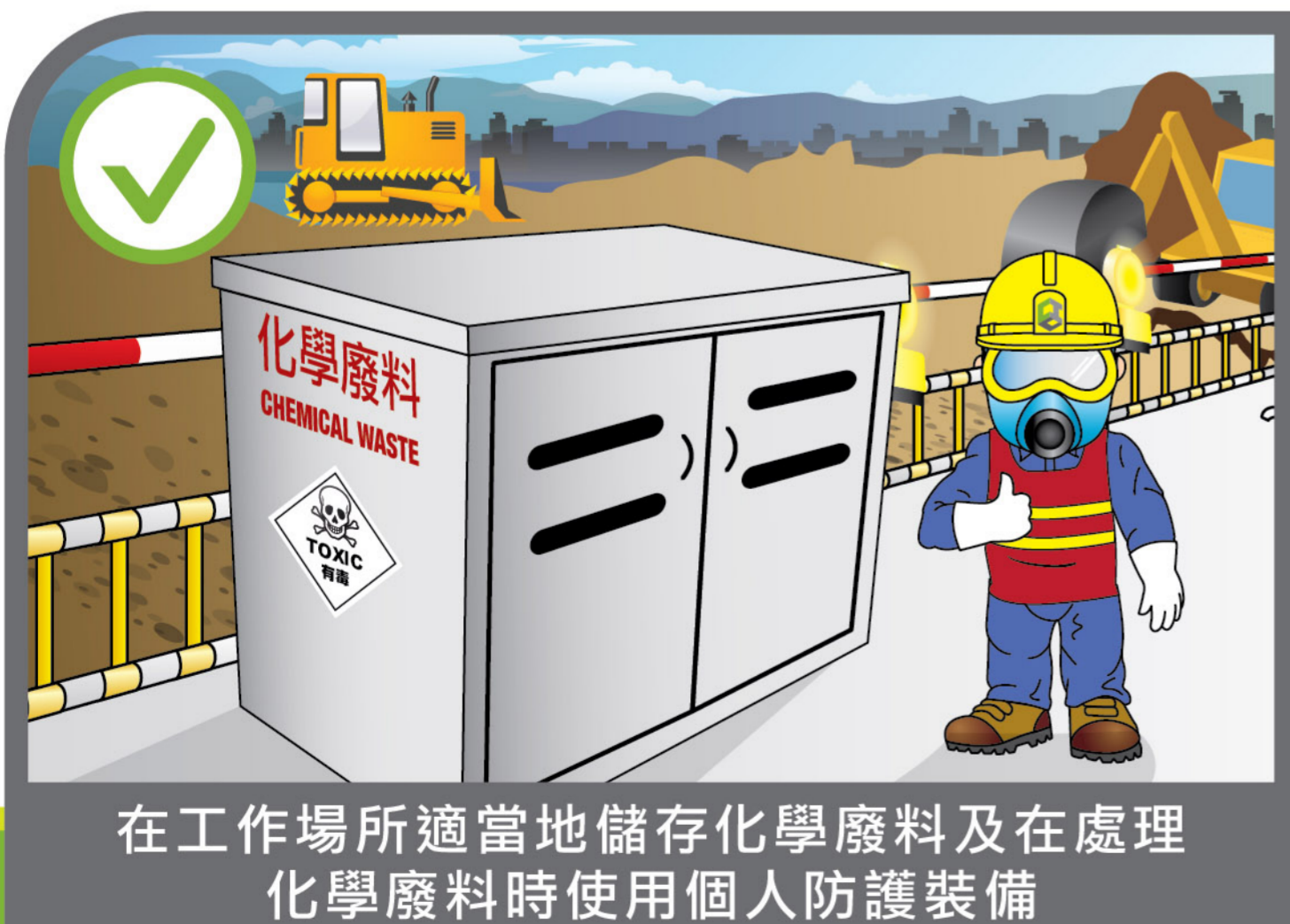
在工作場所適當地儲存化學廢料及在處理 化學廢料時使用個人防護裝備