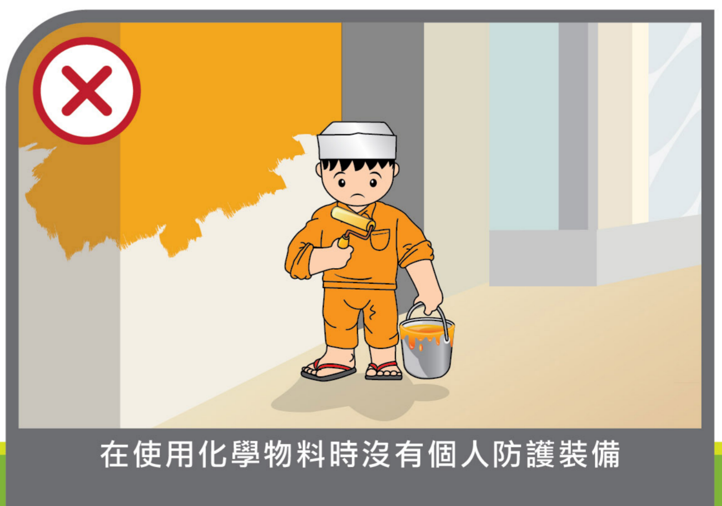
在使用化學物料時沒有個人防護裝備