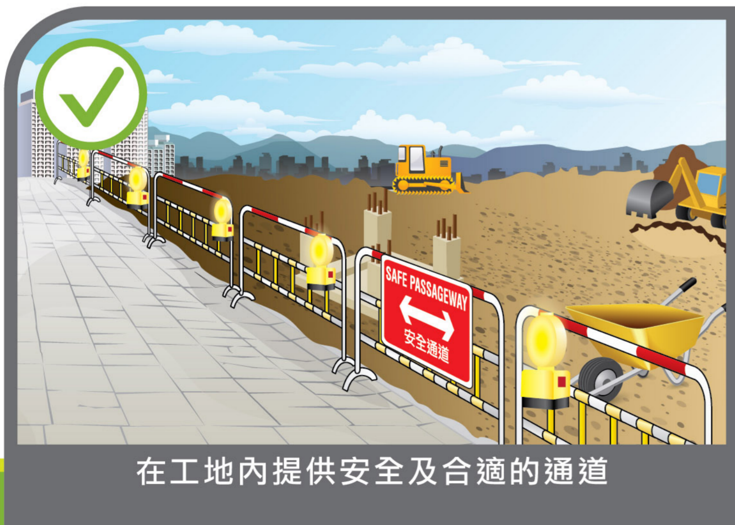
在工地內提供安全及合適的通道