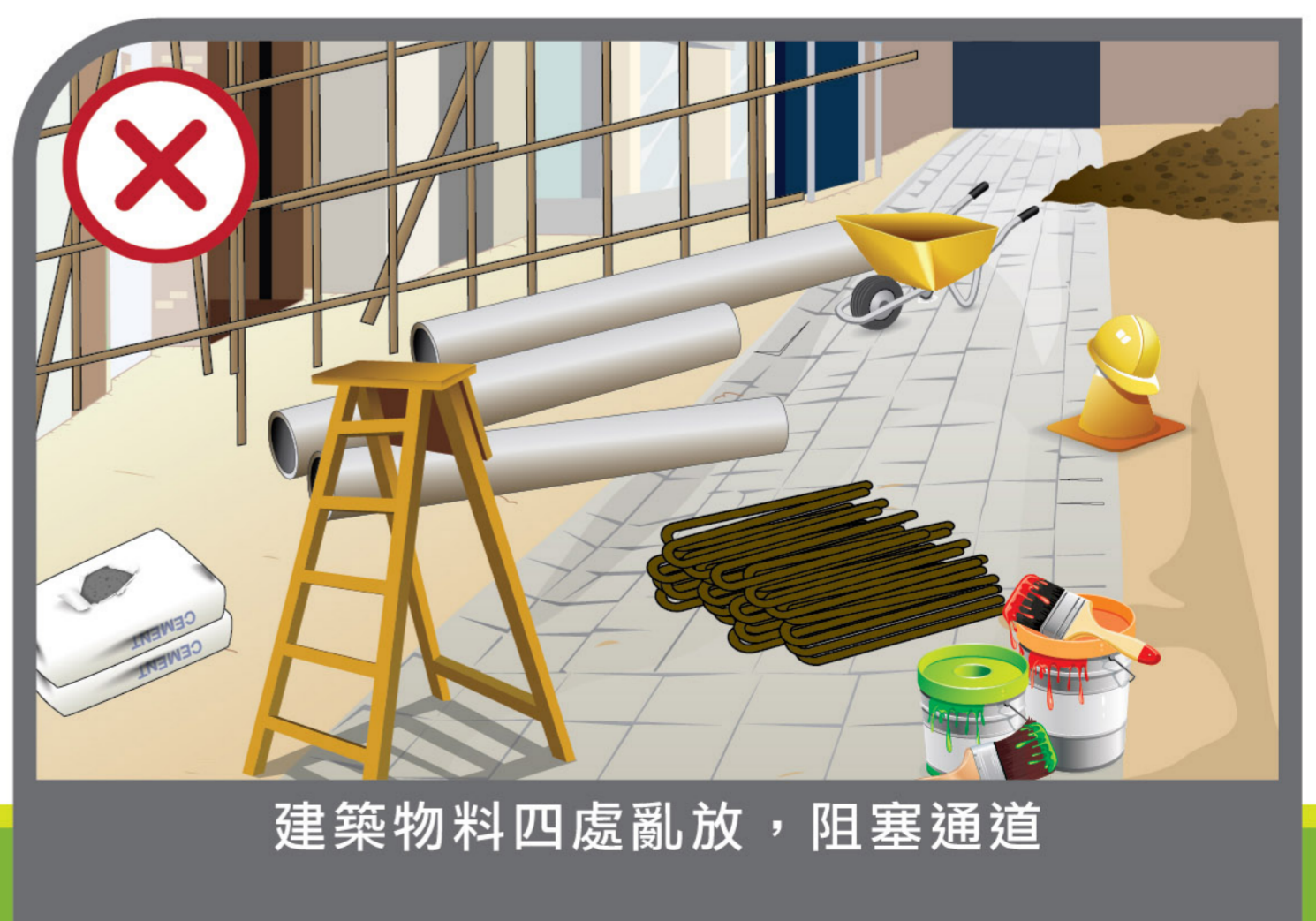
建築物料四處亂放，阻塞通道