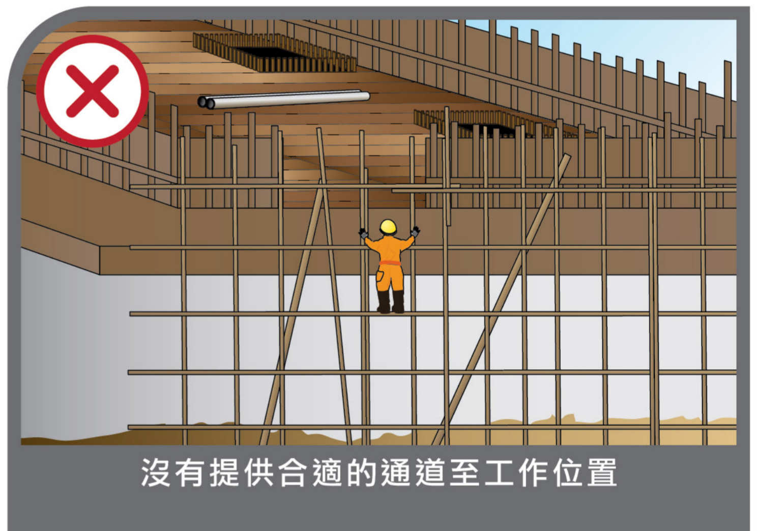
沒有提供合適的通道至工作位置