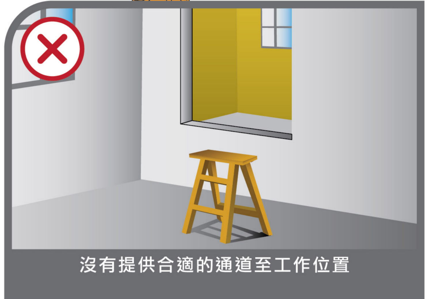
沒有提供合適的通道至工作位置